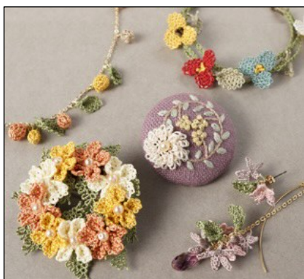
トルコ伝統工芸「イーネオヤ」 by PAPATYA