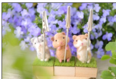
羊毛フェルトの動物雑貨 by Fluffy