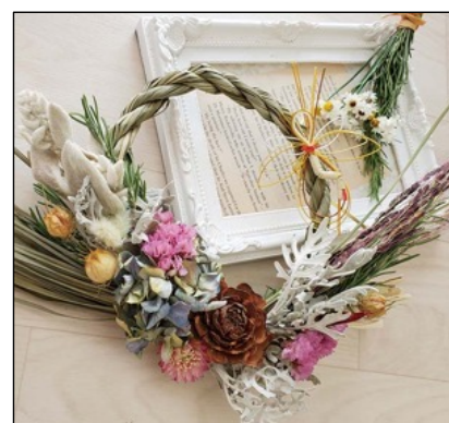
お正月リース作り by 瑠優心-ruuco-