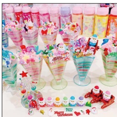
カラーサンドのパフェ作り by Angelica Baby