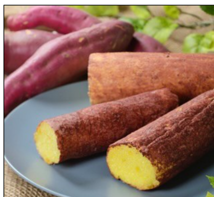
麩菓子 by 麩の菓おふや