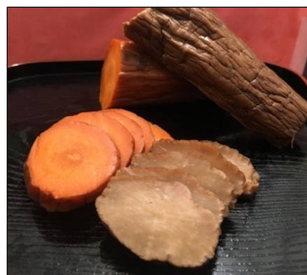
いぶりがっこ by 三吉農園