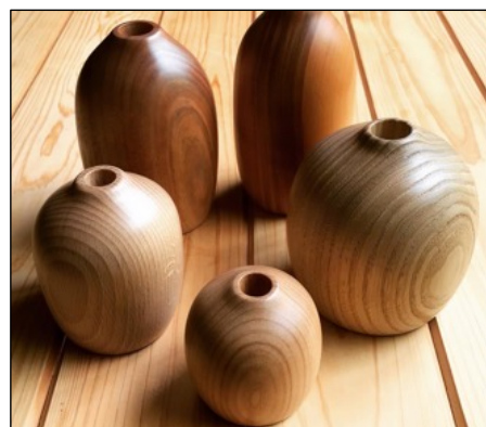
しずくモチーフの木工雑貨 by WOODROPS