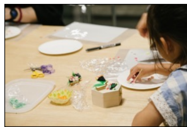
体験教室の様子・2