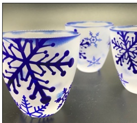
デザイングラス by あとりえしゅう