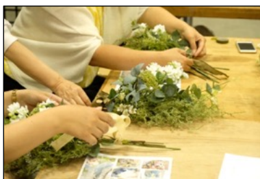
体験教室の様子・1

子供から大人まで、ハンドメイド初体験の方でも気軽に参加できる体験教室「マルシェのがっこう」を開催。ハンドメイド作家自身が先生となって、アクセサリーやフラワーアレンジ、クラフト、伝統工芸まで、 世界にひとつ・自分だけのハンドメイド作品づくりを体験 できます。