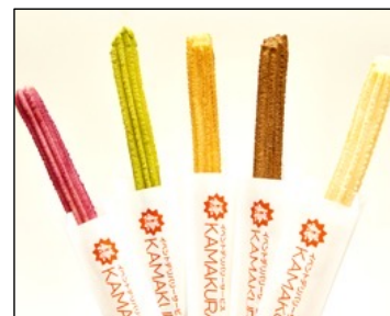
チュロス by 鎌倉チュロス