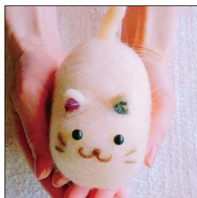
羊毛フェルトのネコ作り by みーにゃ